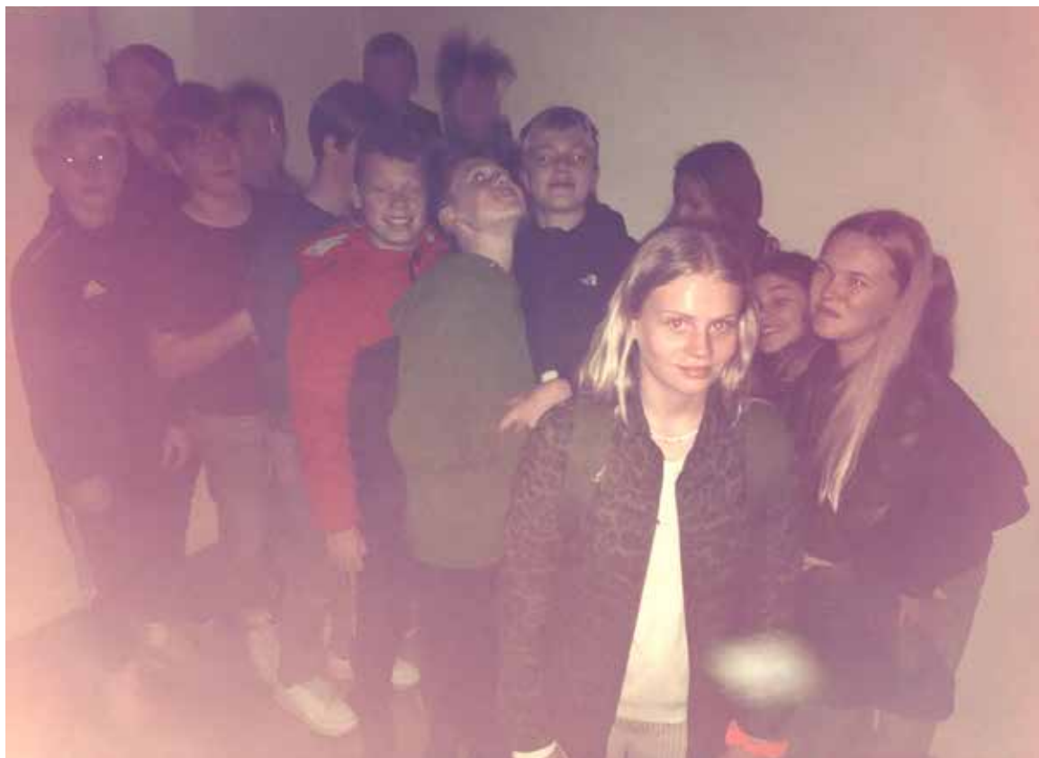
Sådan ser det ud, når 18 konfirmander trænges sammen i en lille mørk celle